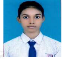
Photo and Signature