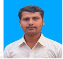
Photo and Signature